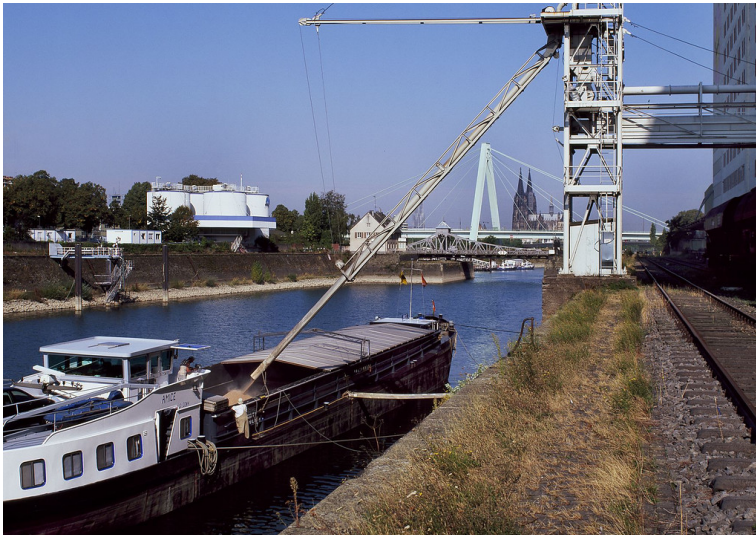
Deutzer Hafen (2018)