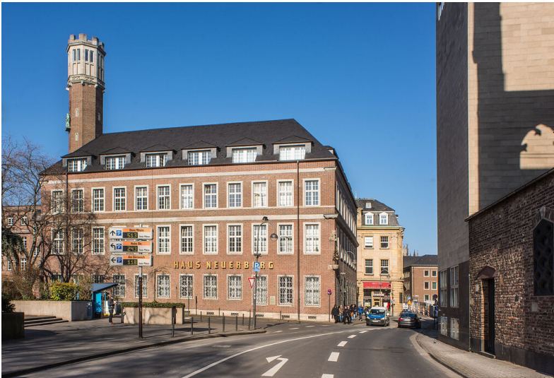
Haus Neuerburg in Köln (2018).