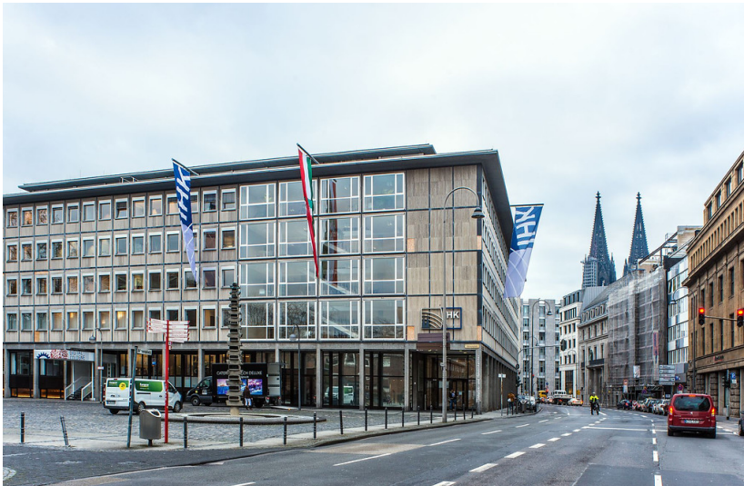
Industrie- und Handelskammer (2018)