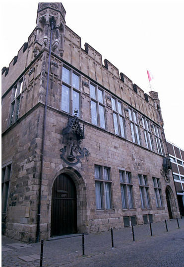
Gürzenich (2018)