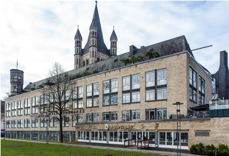
Stapelhaus (2018)