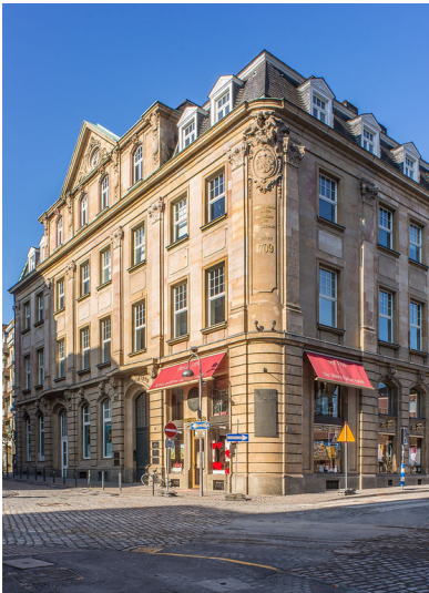
Stammhaus Farina (2018)