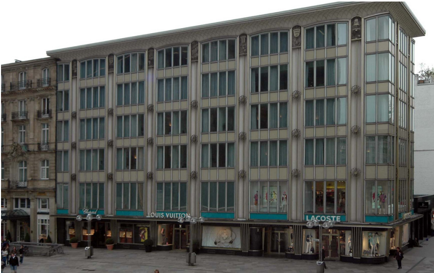
Blau-Gold-Haus (2018)