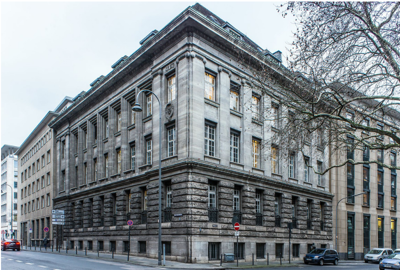
Bankenviertel Köln (2018)