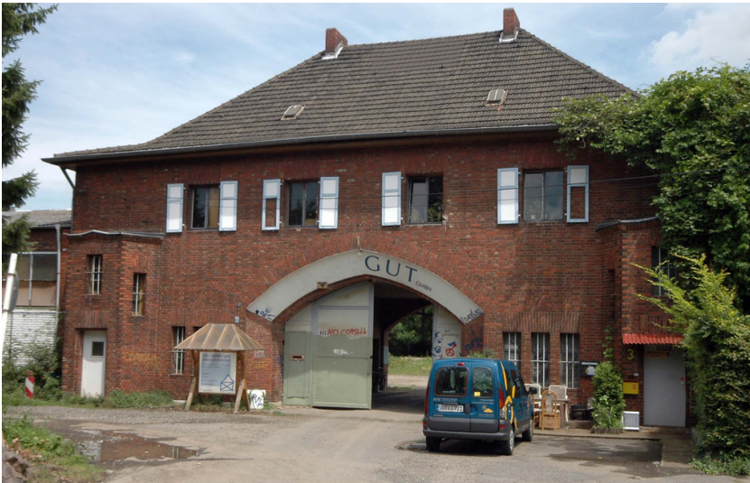
Mülheimer Hafen - Bauunternehmung Gebr. Meyer (2018)