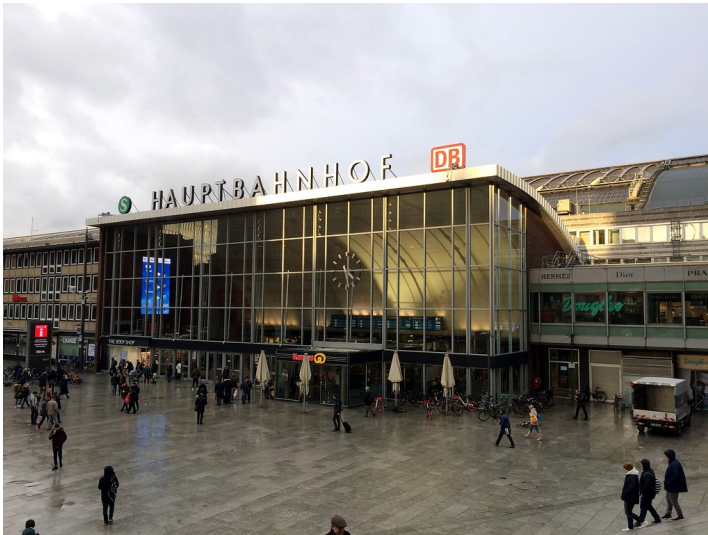
Empfangsgebäude des Kölner Hauptbahnhofs mit dem Bahnhofsvorplatz von Südwesten aus gesehen (2019)