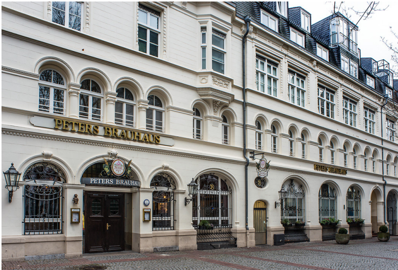
Brügelmannhaus (2018)