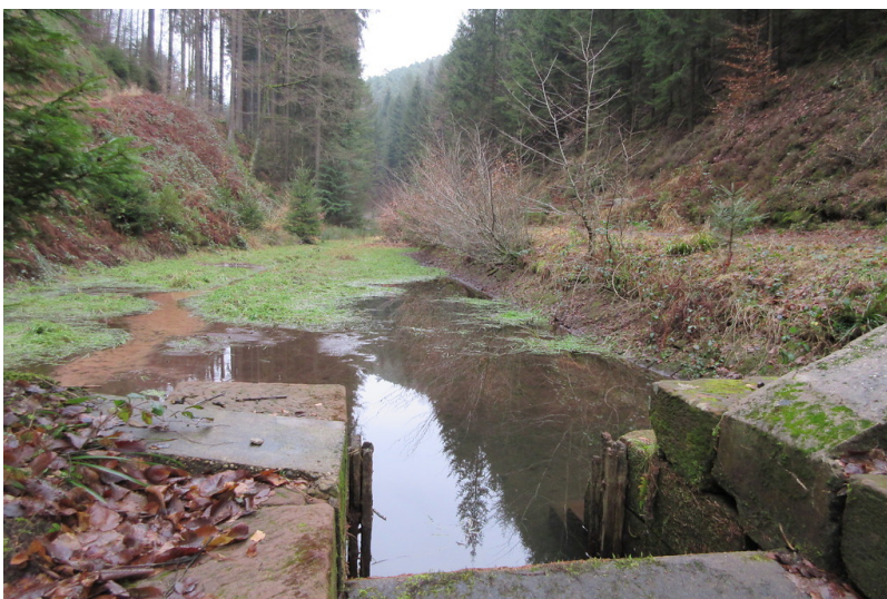
Teilgefülltes Woogbecken