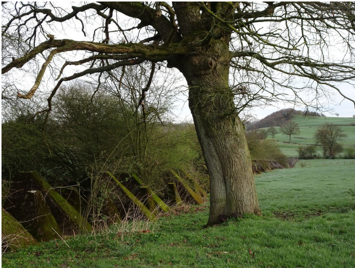
Biotopverbund Westwall bei Aachen-Schmithof (2018)