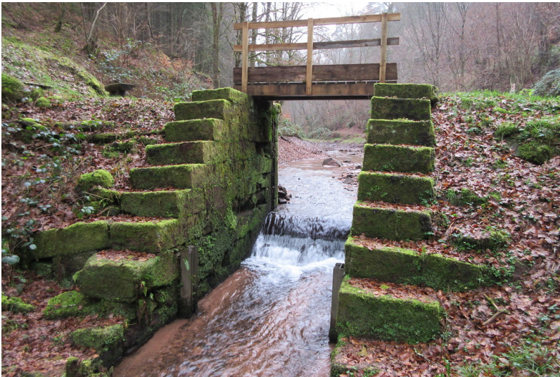
Dammbereich des Pfalzwoogs am Kaltenbach (2018)