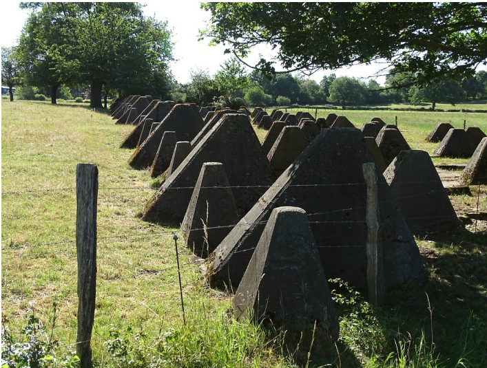
Biotopverbund im Westen - der Westwall im Stadtgebiet von Aachen (2017)