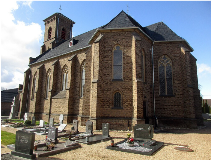
Blick auf die Südseite der katholischen Pfarrkirche Sankt Johann Baptist mit dem umgebenden Friedhof in Vettweiß-Sievernich (2021).