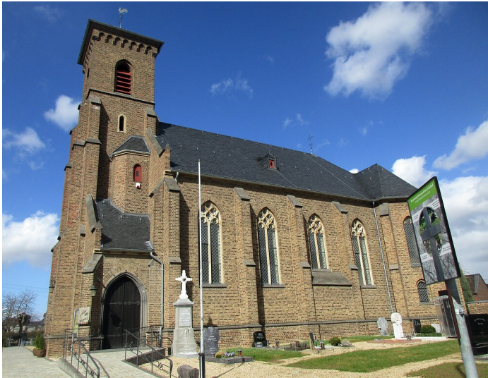
Blick auf die Südseite der katholischen Pfarrkirche Sankt Johann Baptist in Vettweiß-Sievernich (2021).