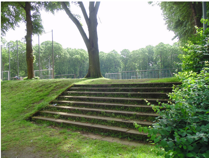
Alter Treppenaufgang zum öffentlichen Aschenplatz am Fort Deckstein in Köln-Lindenthal. Gegenüber befindet sich ein identischer Aufgang zur Heimspielstätte des SC Blau-Weiß Köln 06 (2021).