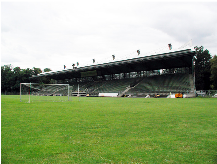
Haupttribüne des Stadions im Sportpark Höhenberg in Köln (2008)