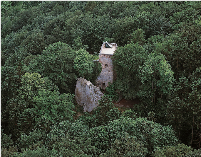
Burgruine Alt-Wolfstein von Norden