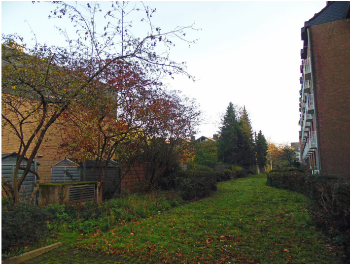
Blick auf das vormalige Gelände des Lindenthaler Kessels in Köln-Lindenthal (2020).