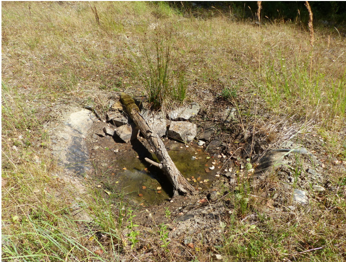
Amphibientümpel im Steinbruch Morkepütz (2018)