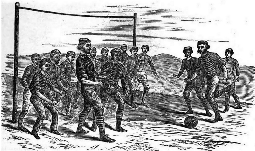
Illustration eines Spiels in der Frühzeit des modernen Fußballs von C. W. Alcock (1874) Fotograf/Urheber: Charles William Alcock