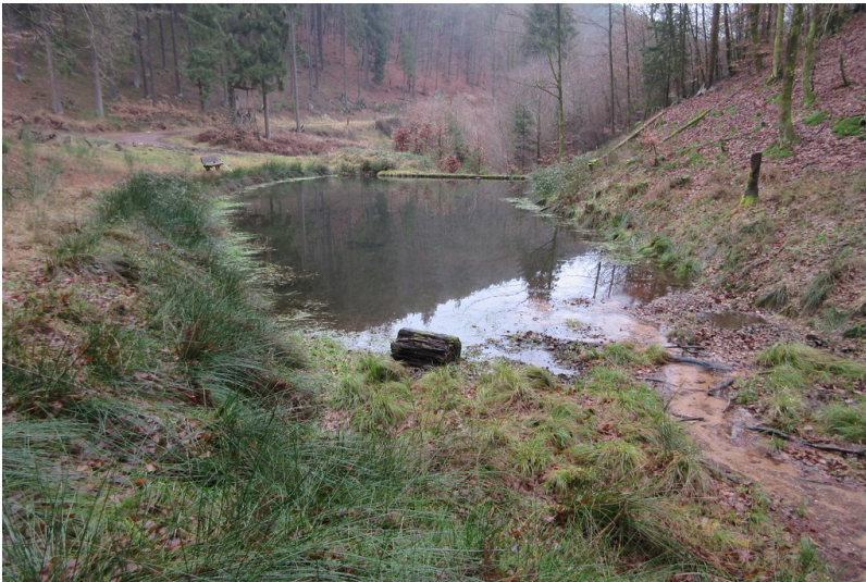
Blick auf den Kroatenwoog