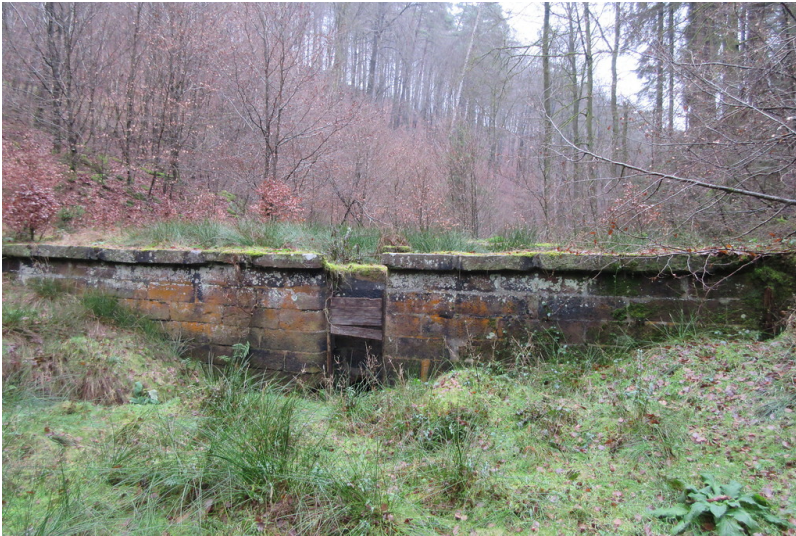
Dammmauer am abgelassenen Woogbecken