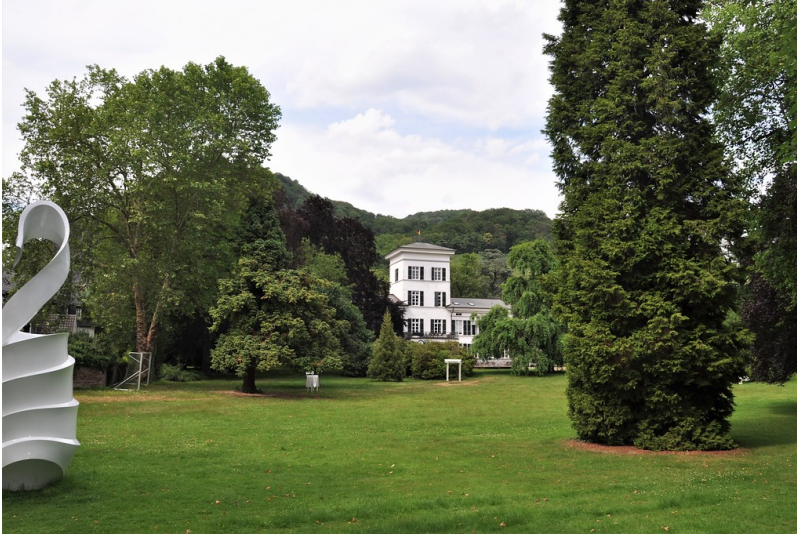
Blick in den Park Villa Merkens in Rhöndorf (2019).