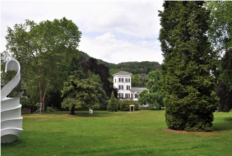
Blick in den Park Villa Merkens in Rhöndorf (2019).