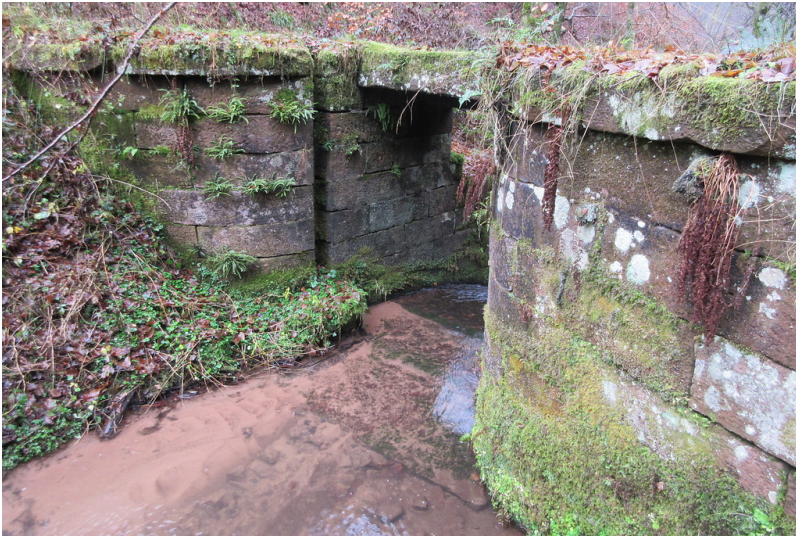
Absperrbauwerk am Breitensteiner Woog am Breitenbach (2018)