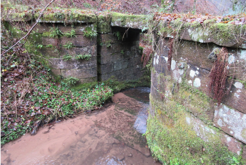
Absperrbauwerk am Breitensteiner Woog am Breitenbach (2018)