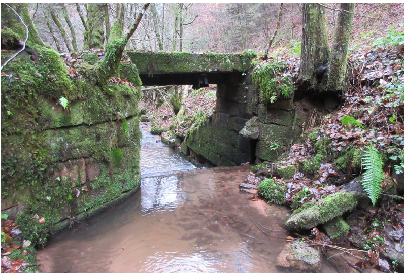
Absperrbauwerk am Wintertaler Woog am Breitenbach (2018)