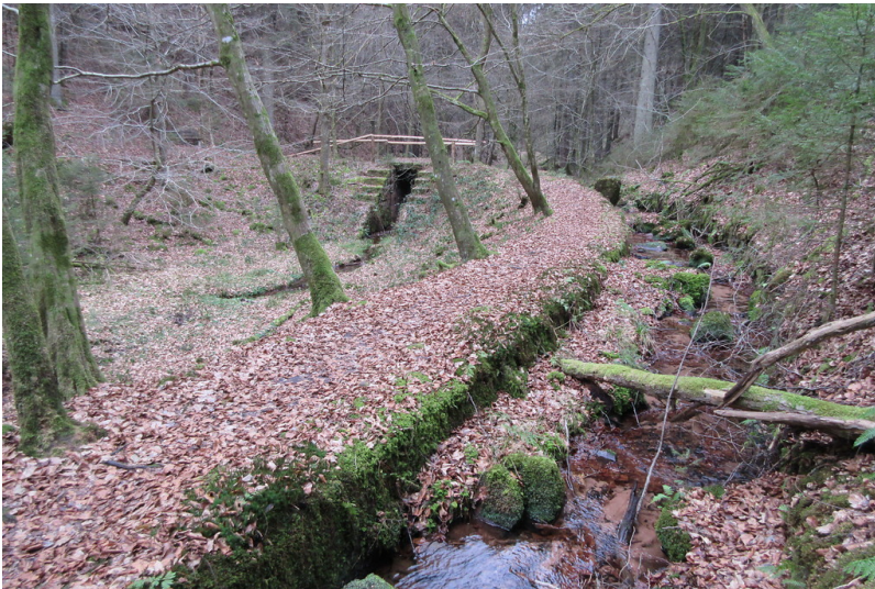
Goldwoog am Breitenbach (2018)