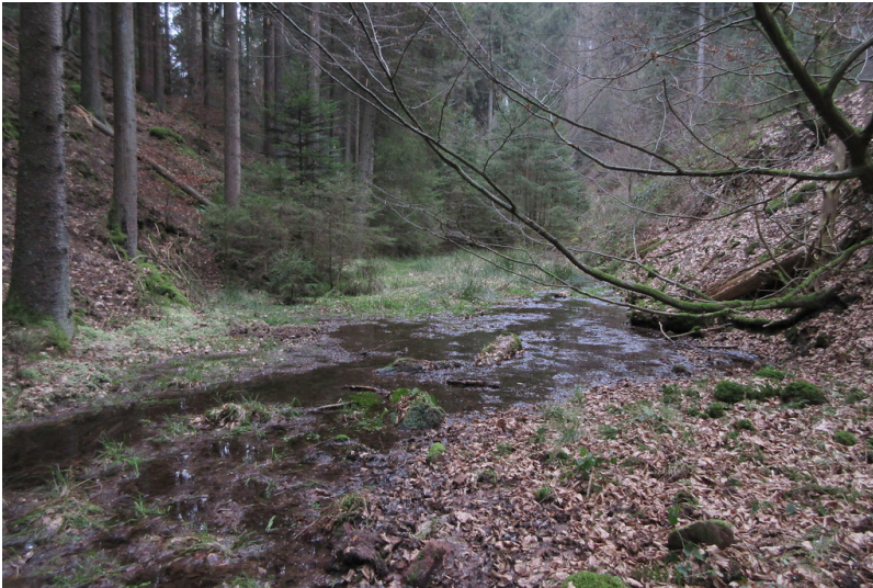
Dreibrunnenthaler Woog am Breitenbach (2018)