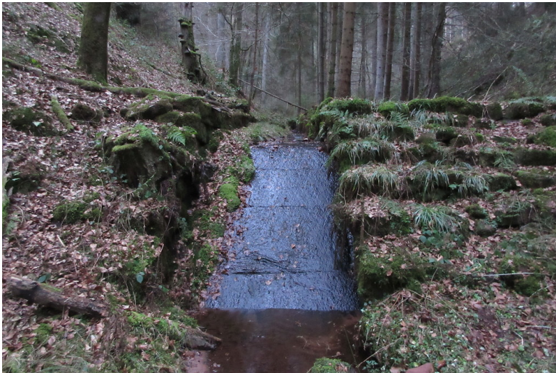
Sohlrampe am Finsterbreitenbach (2018)