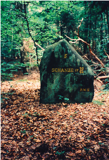
Ritterstein Nr. 174 „Schanze 5 1793/94“ nordöstlich von Fischbach (1997)