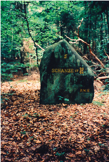
Ritterstein Nr. 174 „Schanze 5 1793/94“ nordöstlich von Fischbach (1997)