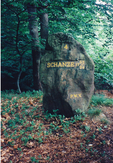
Ritterstein Nr. 173 "Schanze 4 1793/94" nordöstlich von Fischbach (1997)