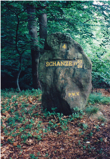
Ritterstein Nr. 173 „Schanze 4 1793/94“ nordöstlich von Fischbach (1997)