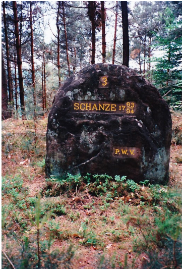
Ritterstein Nr. 172 "Schanze 3 1793/94" nordöstlich von Fischbach (1997)