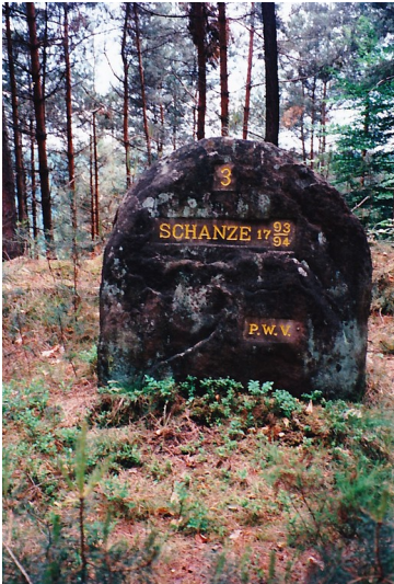
Ritterstein Nr. 172 "Schanze 3 1793/94" nordöstlich von Fischbach (1997)