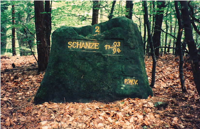
Ritterstein Nr. 171 "Schanze 2 1793/94" nordöstlich von Fischbach (1997)