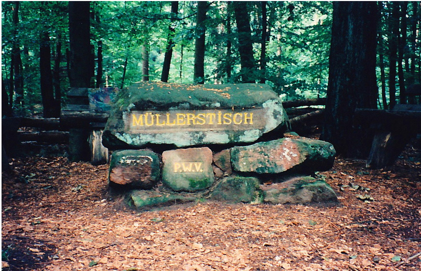
Ritterstein Nr. 169 "Müllerstisch" nordöstlich von Fischbach (1997)