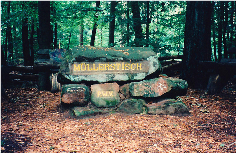
Ritterstein Nr. 169 "Müllerstisch" nordöstlich von Fischbach (1997)