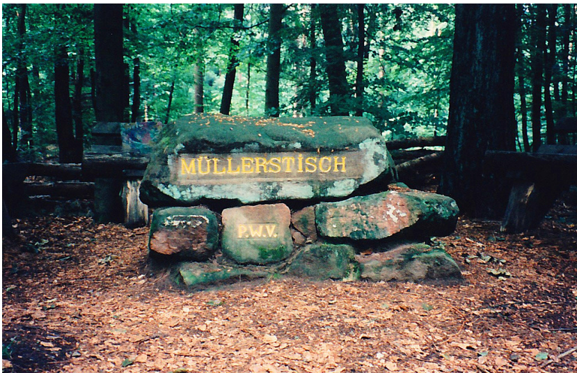
Ritterstein Nr. 169 "Müllerstisch" nordöstlich von Fischbach (1997)