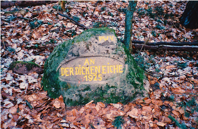
Ritterstein Nr. 168 „An der dicken Eiche 1925“ nordwestlich von Fischbach (2000)