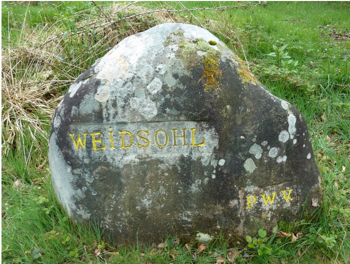
Ritterstein Nr. 167 Weidsohl bei Kaiserslautern (2014)