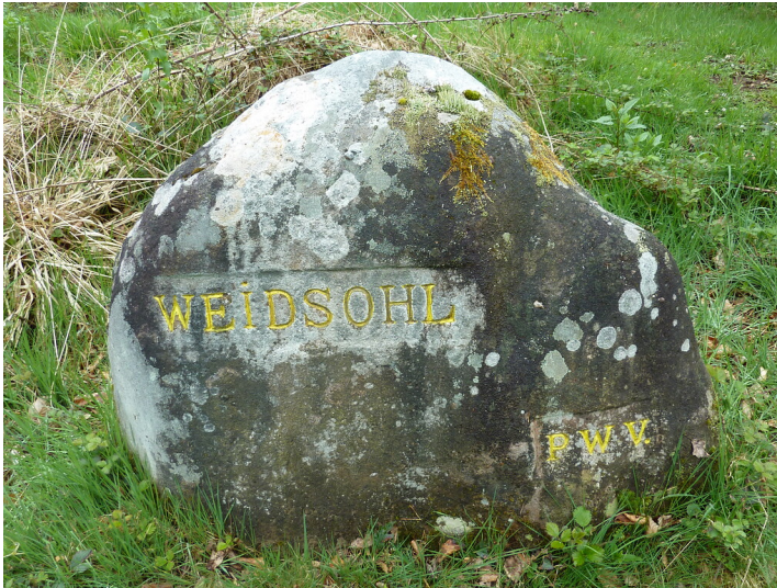
Ritterstein Nr. 167 Weidsohl bei Kaiserslautern (2014)