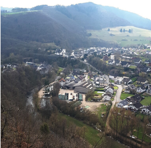
Blick von Osten her auf die Ortsgemeinde Schuld im Ahrtal (April 2021).

Bundesland: Nordrhein-Westfalen , Rheinland-Pfalz