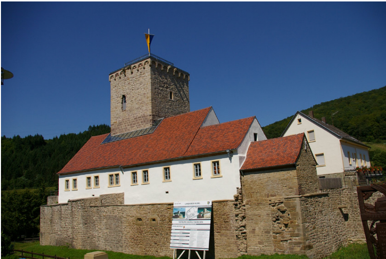
Gesamtansicht von Südwesten