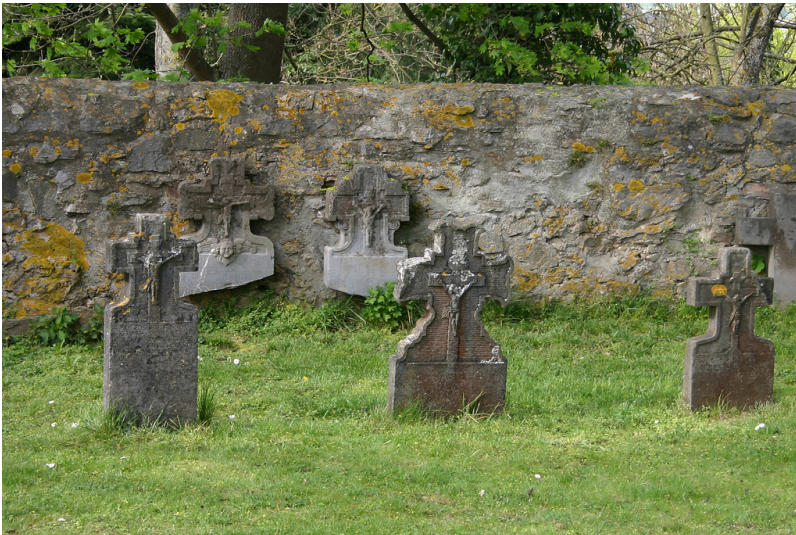
Grabdenkmäler auf dem Friedhof an der St. Lubentius-Kirche in Dietkirchen (2014)