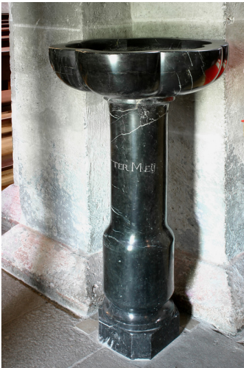
Weihwasserbecken in der St. Lubentiuskirche zu Dietkirchen (2007)