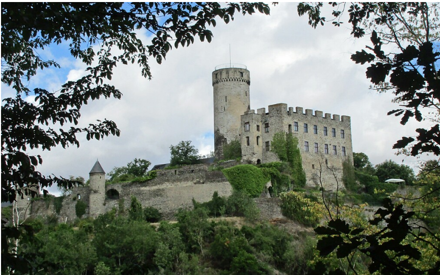
Blick von Süden auf die Burg Eltz zwischen Roes und Pillig (2020).